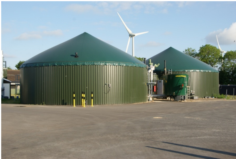
Foto 1; ACRRES-vergister Lelystad (links vergister en rechts navergister).

De ACRRES-vergistingsinstallatie bestaat uit een vergister en een navergister. Beide hebben een inhoud van circa 500 m 3 . De vergister en de navergister zijn volledig geroerde vergisters. Het biogas wordt opgevangen onder het gasdak boven de vergister en verbrand in een warmte kracht koppeling (WKK). Deze motor drijft een generator met een vermogen 120 kW aan. De warmte uit rookgassen en koelwater wordt gebruikt om de vergister op temperatuur te houden en de restwarmte wordt gebruikt voor verwarming van de bio-ethanol installatie en de algenvijvers. De vergister werkt in het mesofiele temperatuur gebied ( \pm 38-40 graden °C).